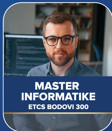
MASTER INFORMATIKE ETCS BODOVI 300