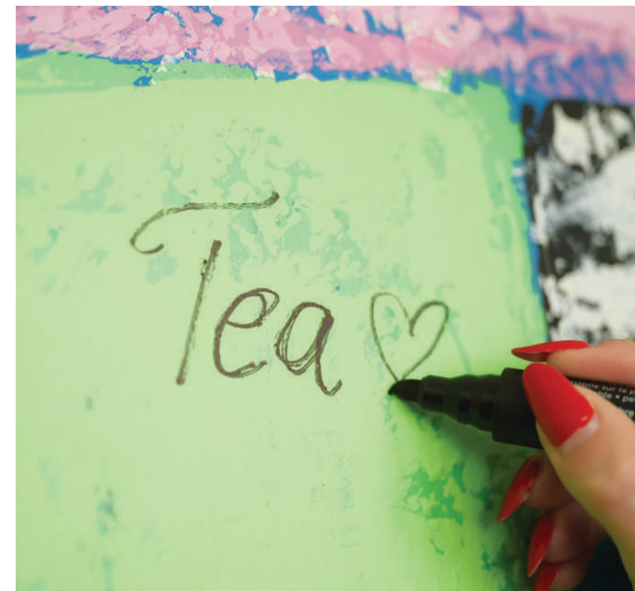
Studentski klub je omiljeno mjesto za kafu, odmor i druženje studenata.