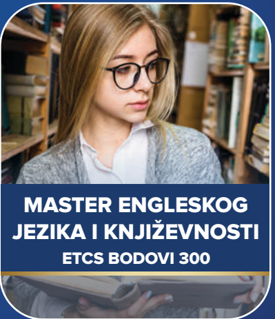
MASTER ENGLESKOG JEZIKA I KNJIŽEVNOSTI ETCS BODOVI 300