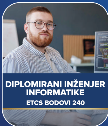
DIPLOMIRANI INŽENJER INFORMATIKE ETCS BODOVI 240

Na drugom ciklusu studija studenti mogu birati između dva smjera: Smjer za informacione sisteme i Smjer za telekomunikacije i računarske mreže.