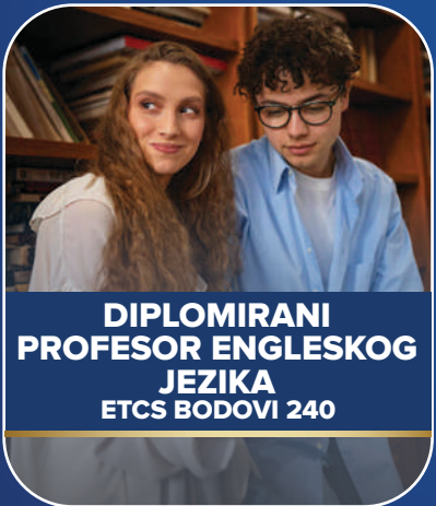
DIPLOMIRANI PROFESOR ENGLESKOG JEZIKA ETCS BODOVI 240

Tokom studija razvijaju visoke jezičke kompetencije, kao i vještine komunikacije, timskog rada, kreativnosti i odgovornosti, koje su važne za rad u nastavi, prevodilaštvu, obrazovanju i drugim profesionalnim okruženjima.