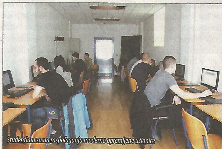
Studentima su na raspolaganju moderno opremljene učionice