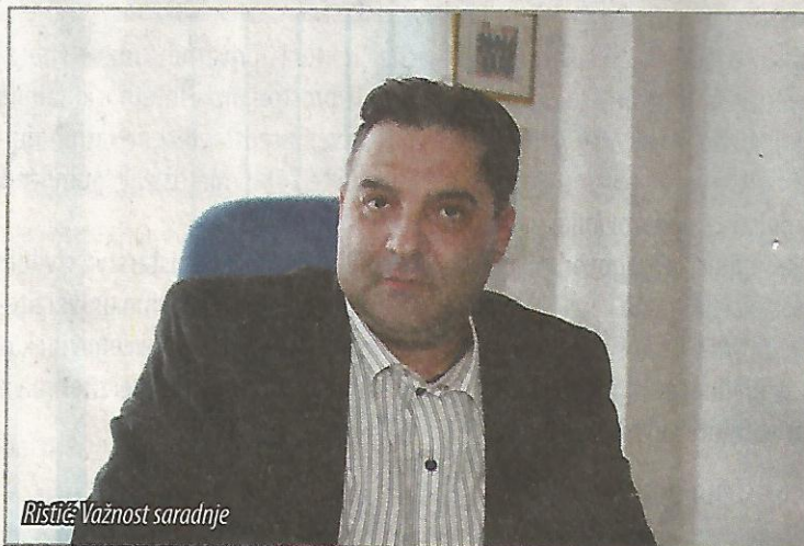
Ristić: Važnost saradnje